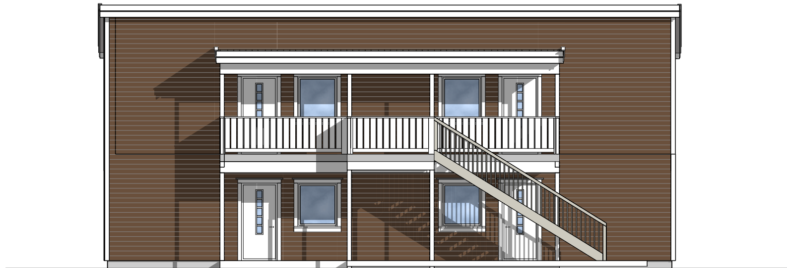
FASADE MOT: NORD